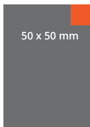
TABELA PUBLICIDADE 2016